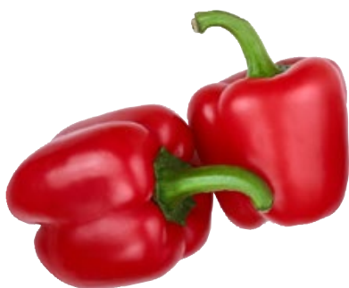
Paprika rood TotaalVERS, per stuk, Art. nr. 20000255