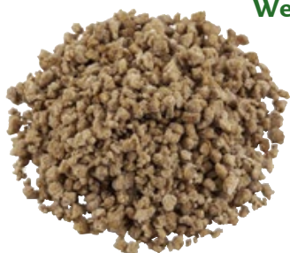
Quorngehakt Vegetarisch, Bergwerf, bak 100 g, Art. nr. 31037302