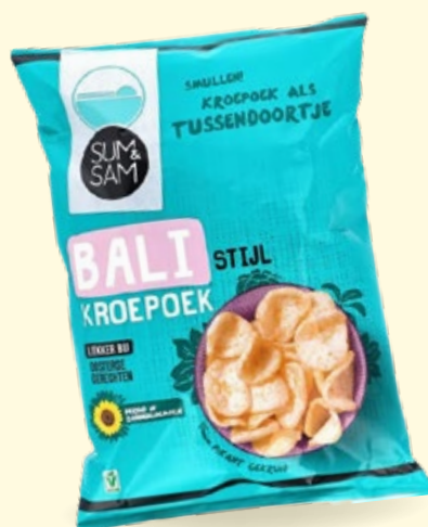
Kroepoek bali Sum en Sam, zak 100 g, Art. nr. 95864335