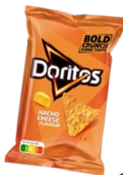
Doritos nacho cheese Doritos, zak 170 g, Art. nr. 95275000