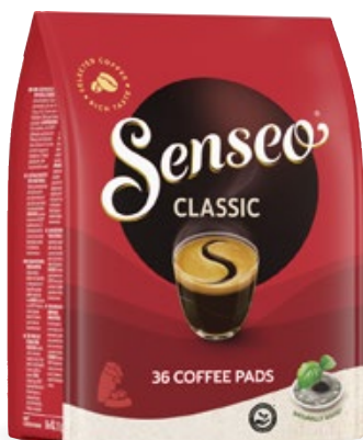
Senseo classic Douwe Egberts, zak 36 stuks, Art. nr. 95975542