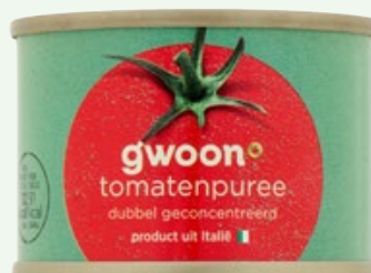
Tomatenpuree dubbelgeconcentreerd, G'woon, blik 70 g, Art. nr. 95323734