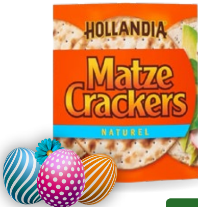
Matze crackers Hollandia, pak 100 g, Art. nr. 95205790