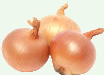
Uien Hollands, grof, TotaalVERS, per kilo, Art. nr. 20000156