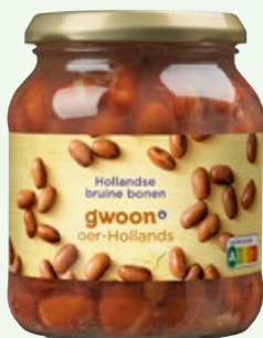
Bruine bonen G'woon, pot 340 g, Art. nr. 95552406