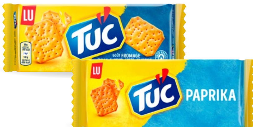
Tuc LU, pak 100 g, Cheese Art. nr. 95535591 Paprika Art. nr. 95984102