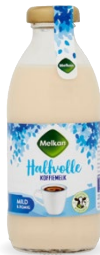
Koffiemelk Halfvol, Melkan, bus 250 g, Art. nr. 95217400