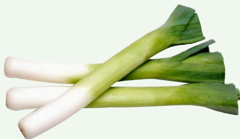
Prei TotaalVERS, per kilo, Art. nr. 20000172