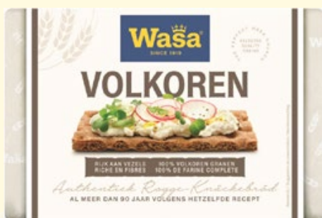
Knäckebrod Volkoren, Wasa, pak 260 g, Art. nr. 95166720