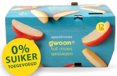
Appelmoes G'woon, 12 x 100 g, Art. nr. 95460005