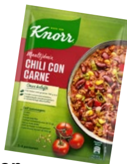
Chili Con Carne Mix Knorr, zak 42 g, Art. nr. 95295299